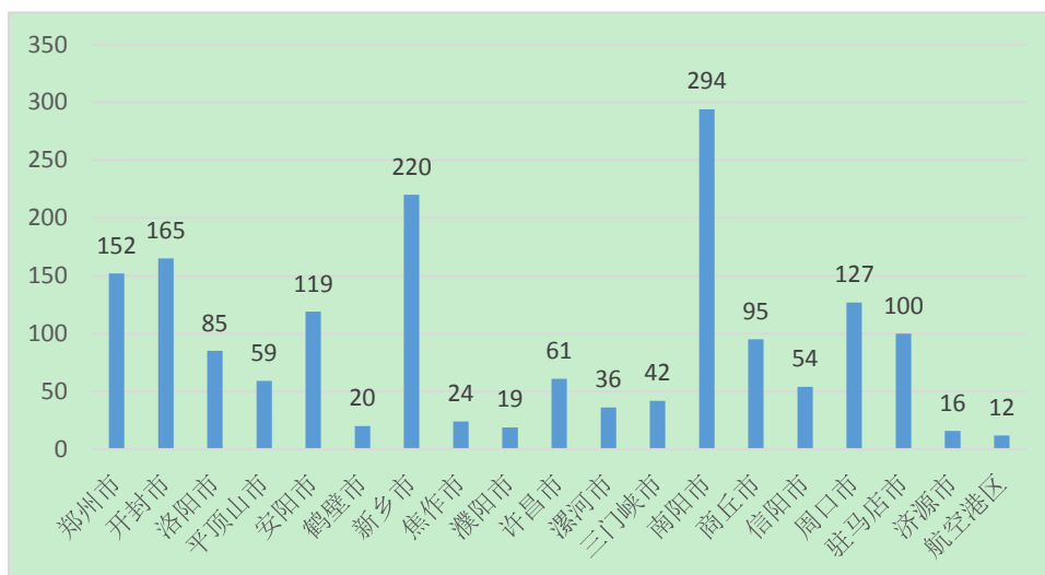
表6 全省电话举报污染类型占比